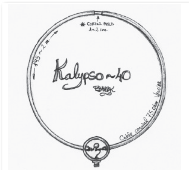
Lámina 1. Construcción de la Kalypso para 40 m