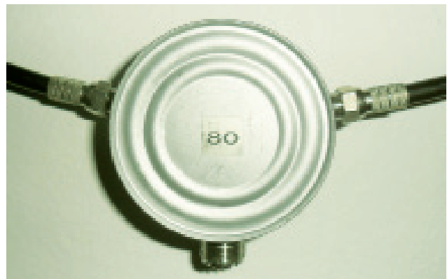
Foto 2. Construcción desmontable con conectores F y PL estilo «Tuna Thin»